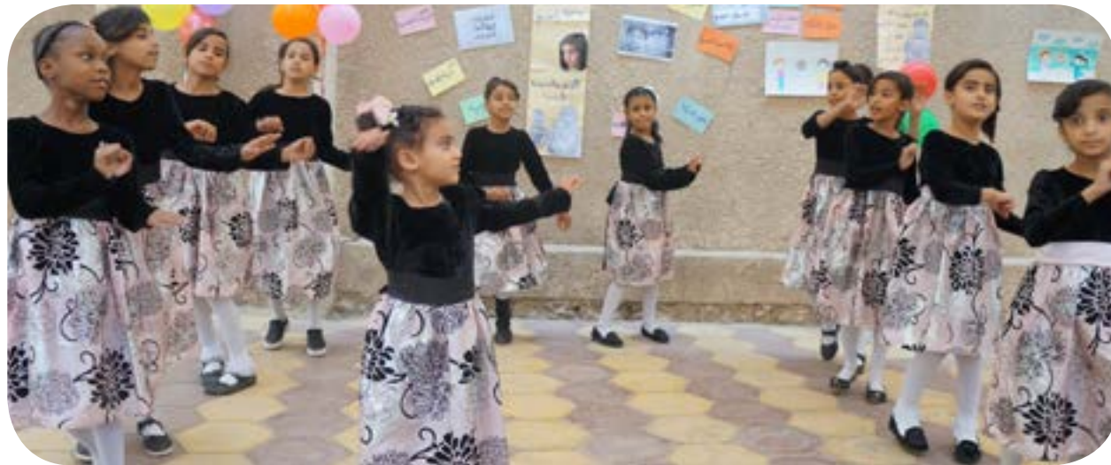
فعالية الطبق الخيري الشهري