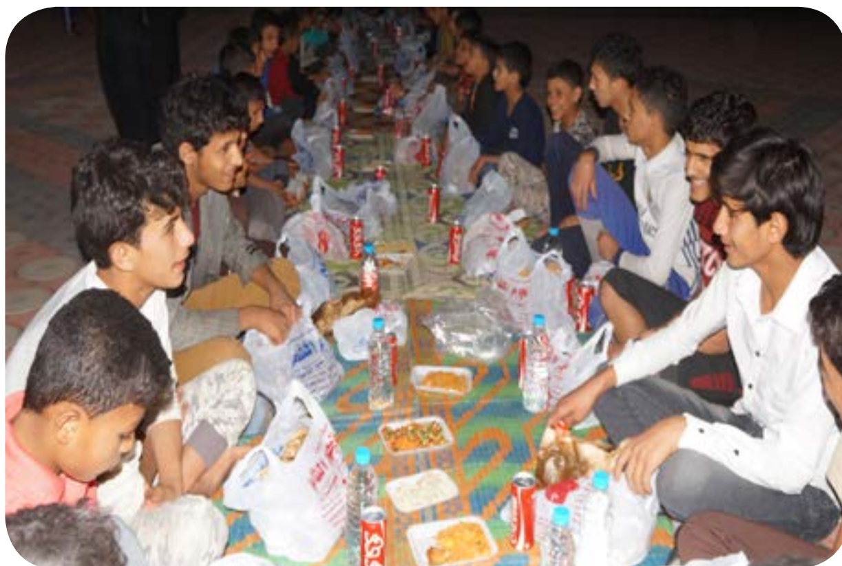
افطار صائم - بنين