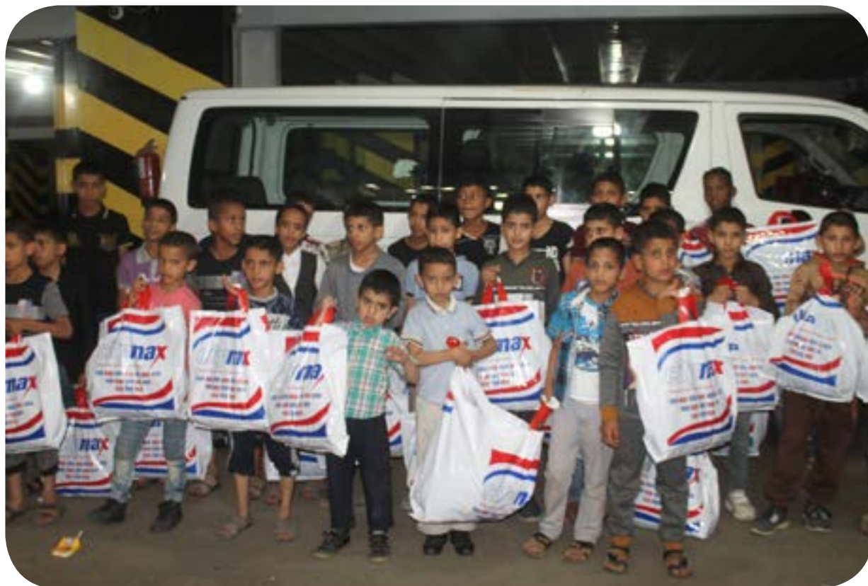
شراء كسوة العيد