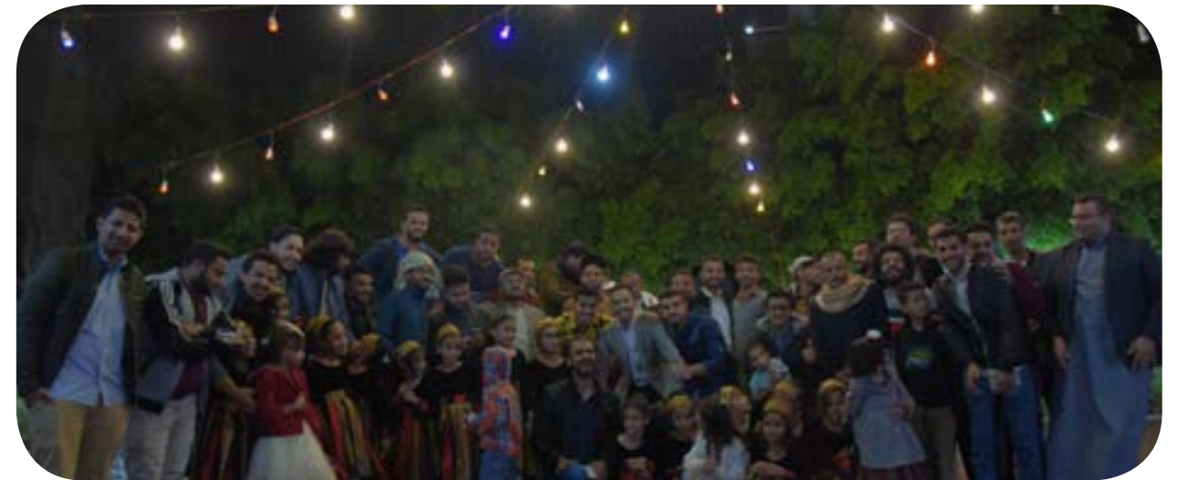
اللقاء السنوي للإعلاميون