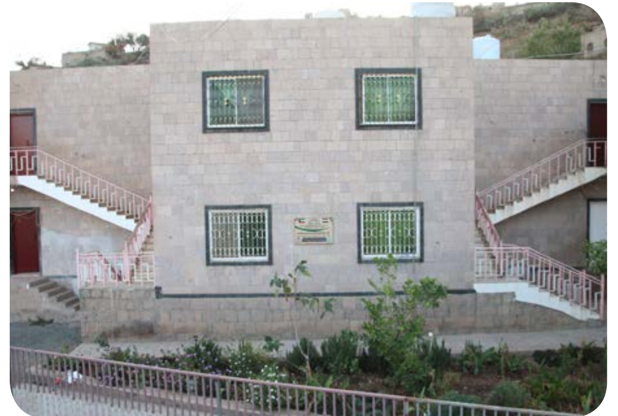
ترميم وصيانة مباني فرع السحول - اب