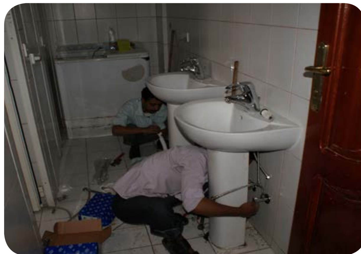
الصيانة الدورية للشقق