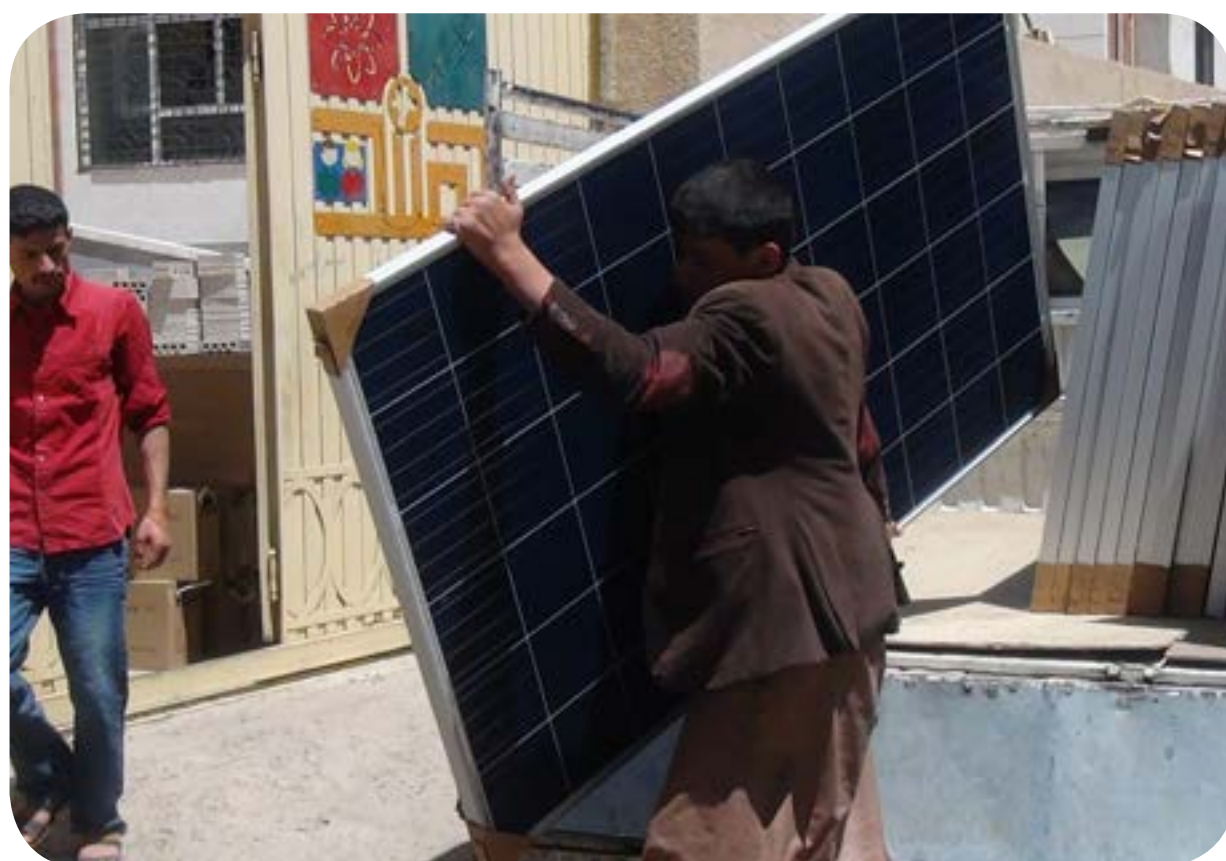
توريد وتركيب الطاقة الشمسية - بنات