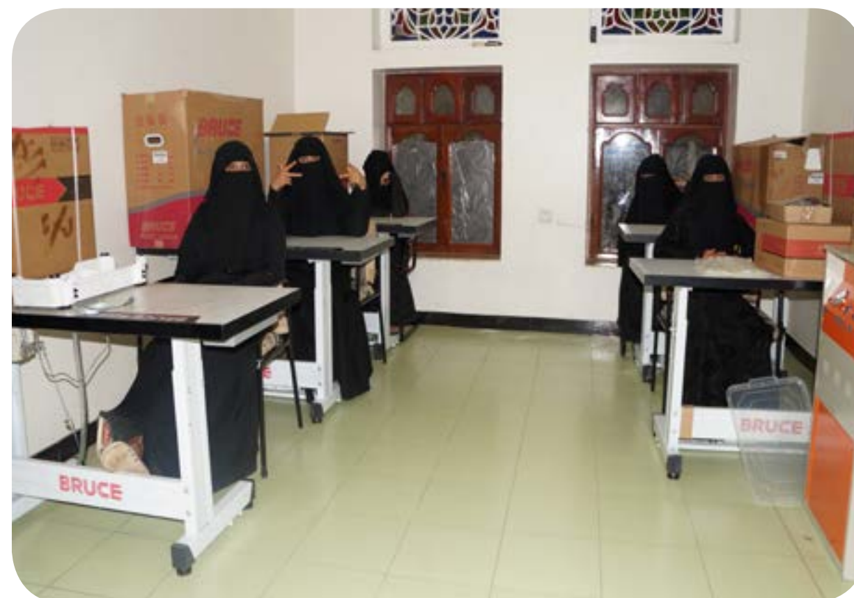
شراء ٦ مكائن خياطة للمشغل - المركز الرئيسي