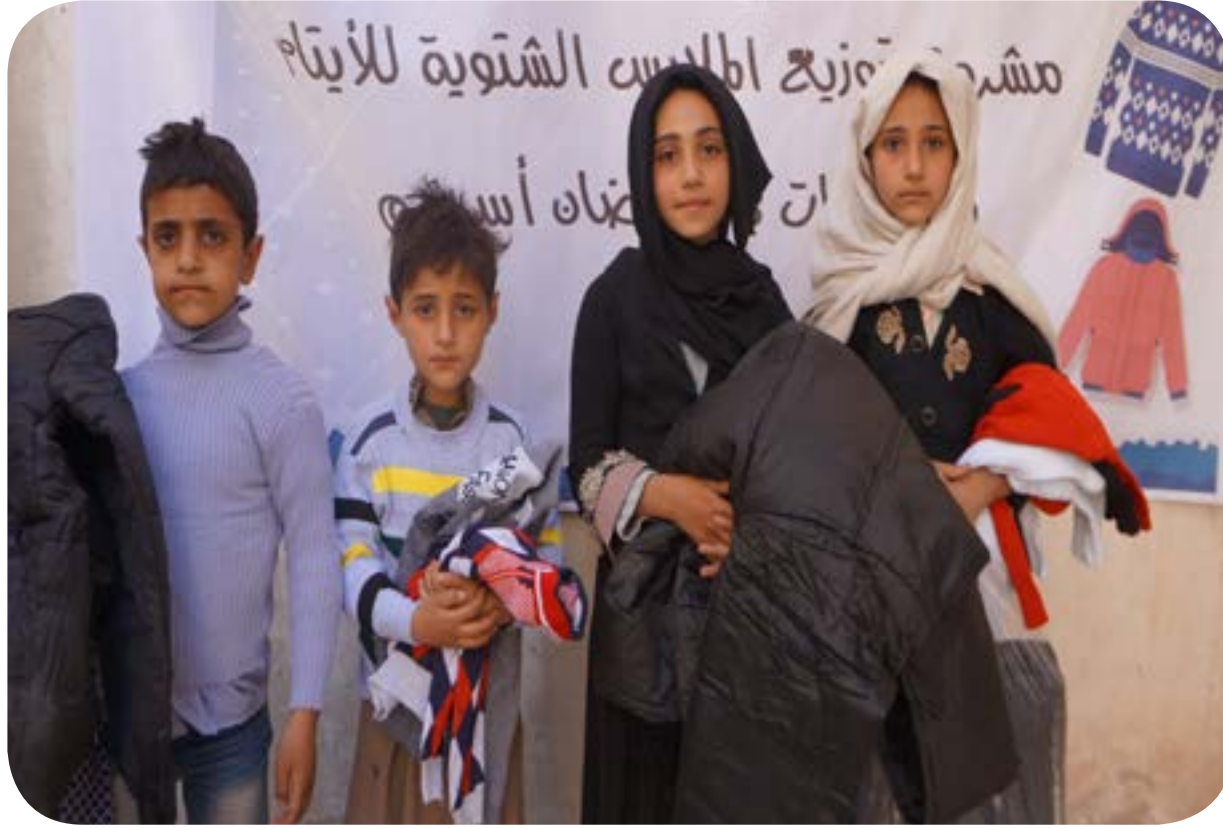
توزيع الملابس الشتوية للأيتام المكفولين في احضان اسرهم