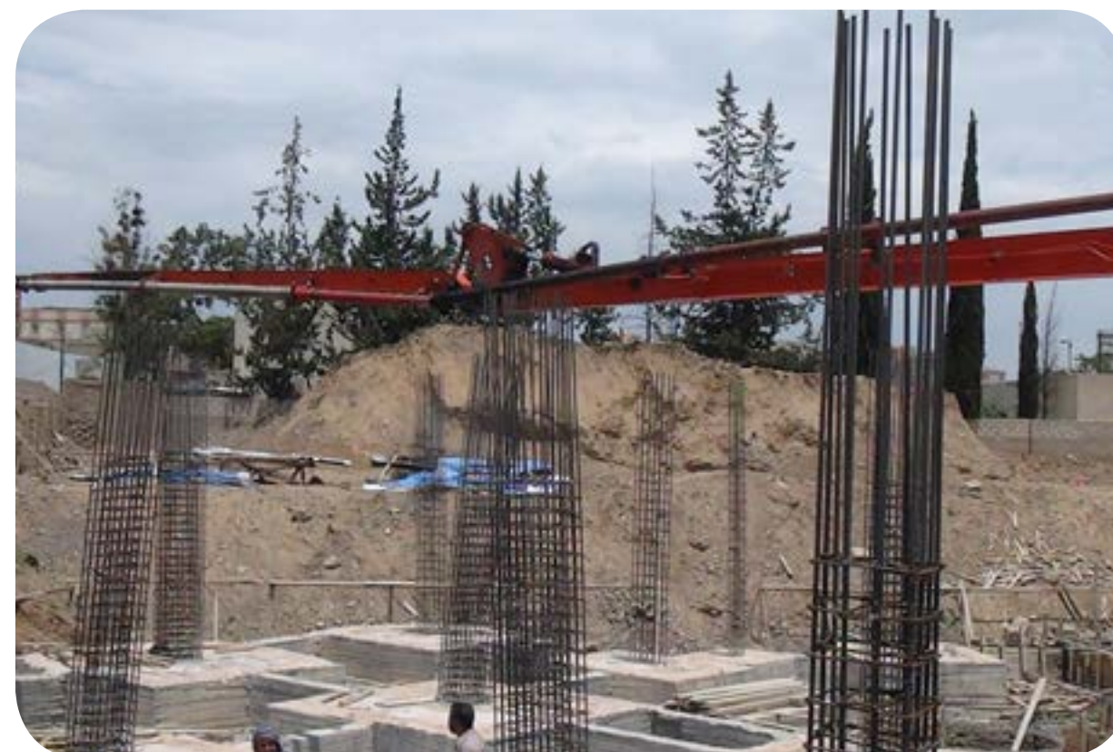
بناء مركز التدريب والتأهيل - صنعاء