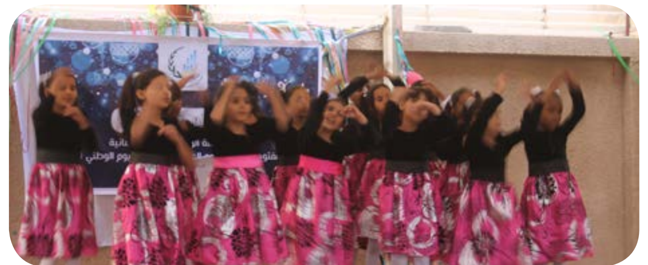
فعالية اليوم العالمي للتطوع