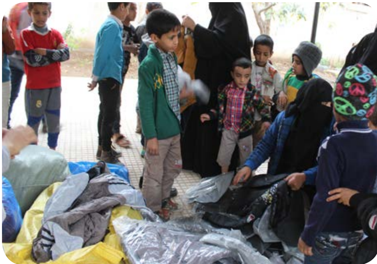
توزيع كسوة الشتاء للسكن الداخلي