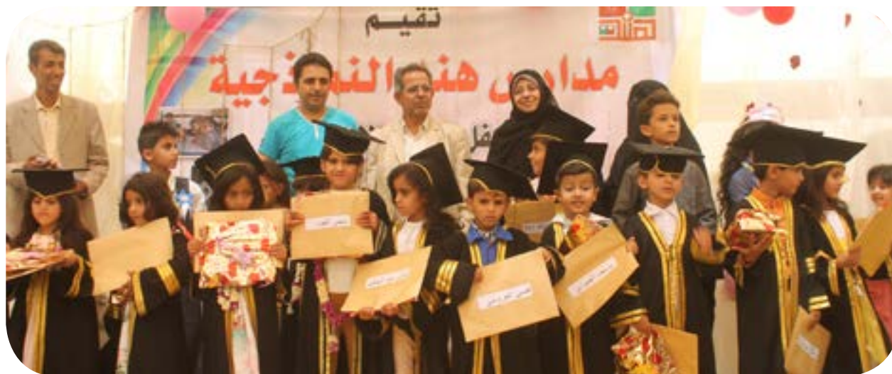
فعالية تكريم الاوائل