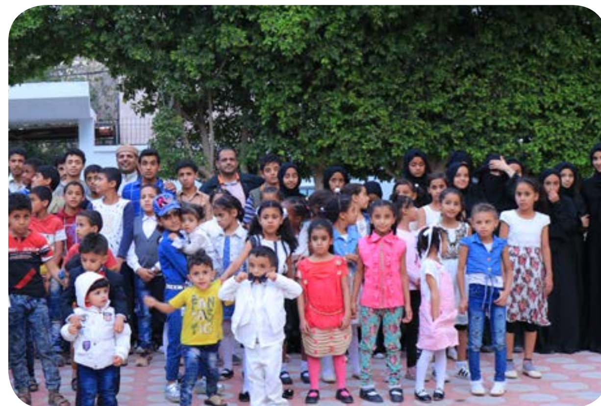
تأثيث معمل حاسوب - بنات