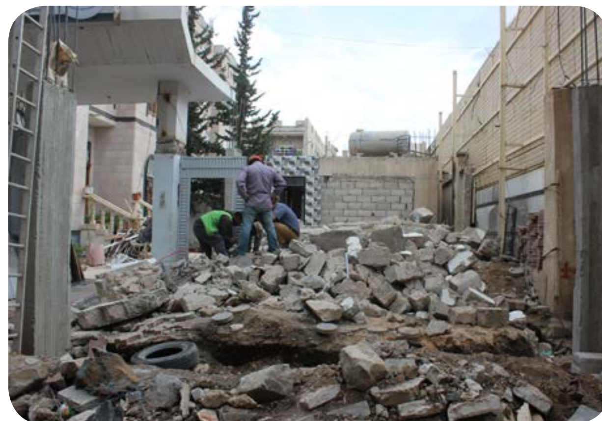
بناء مكتب الإستقبال - المركز الرئيسي