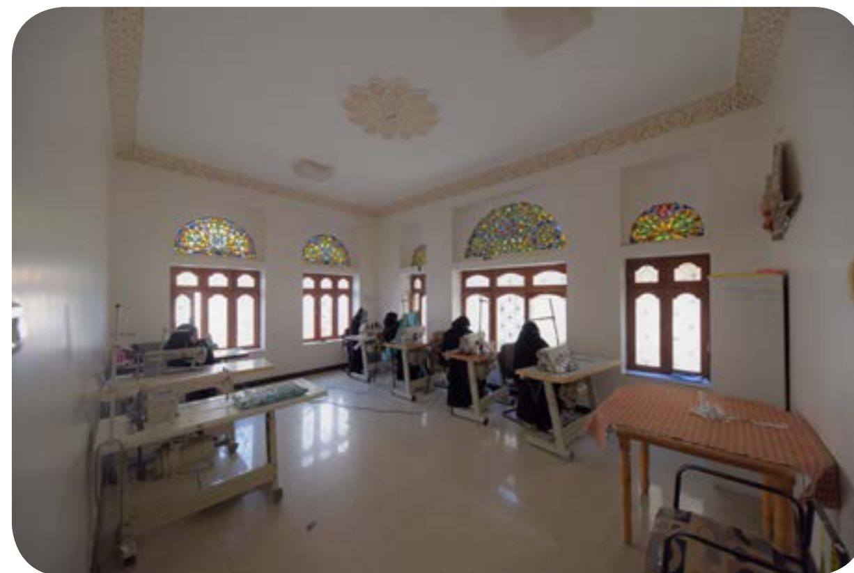
مشغل خياطة وتطريز