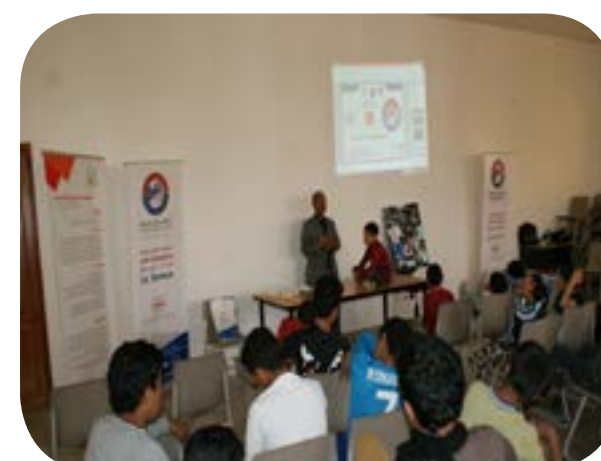
توعية الأمن والسلامة