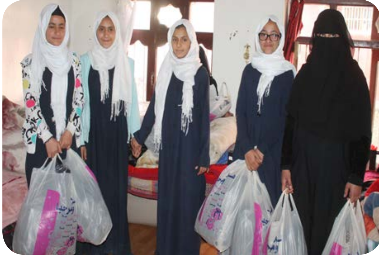
توزيع الجواكت الشتوية لدار الشفقة