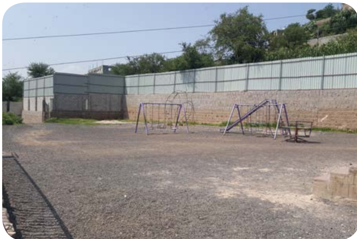
بناء سور حماية لفرع السحول - اب