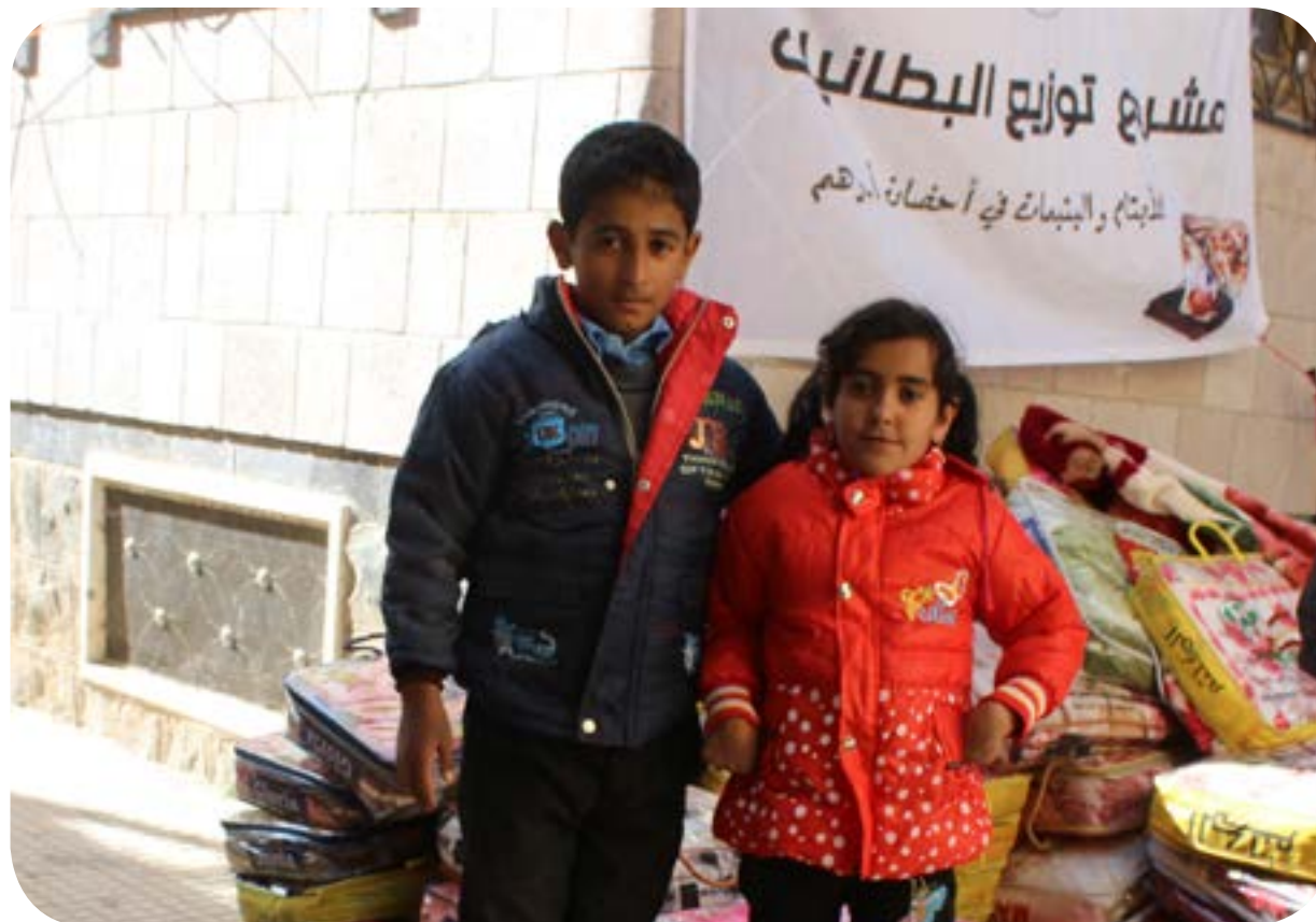
توزيع البطانيات للأيتام المكفولين في أحضان أسرهم