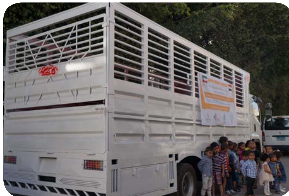
شراء سيارة نقل