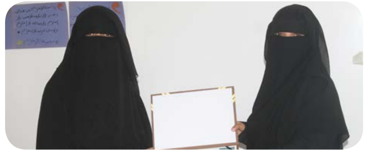
تكريم الموظفين المثاليين للعام ٢٠١٩م