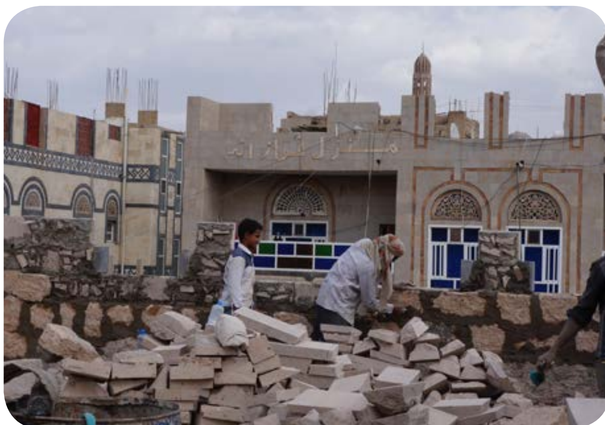
بناء قاعة متعددة الأغراض - المركز الرئيسي