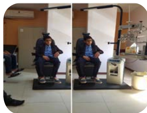
الكشف الدوري للأسنان