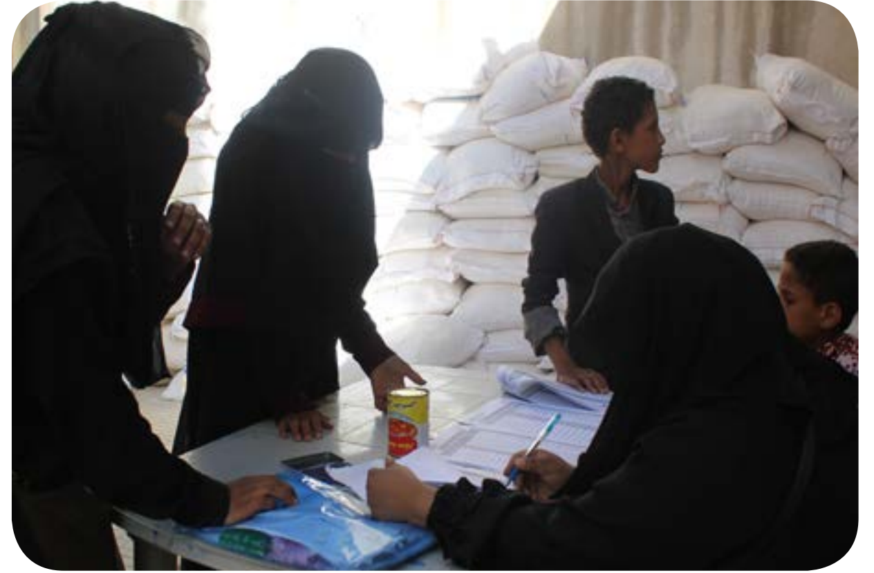
توزيع الحقيبة الغذائية للأيتام المكفولين في احضان اسرهم