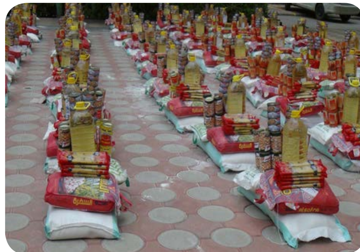
توزيع المواد الغذائية الشهري