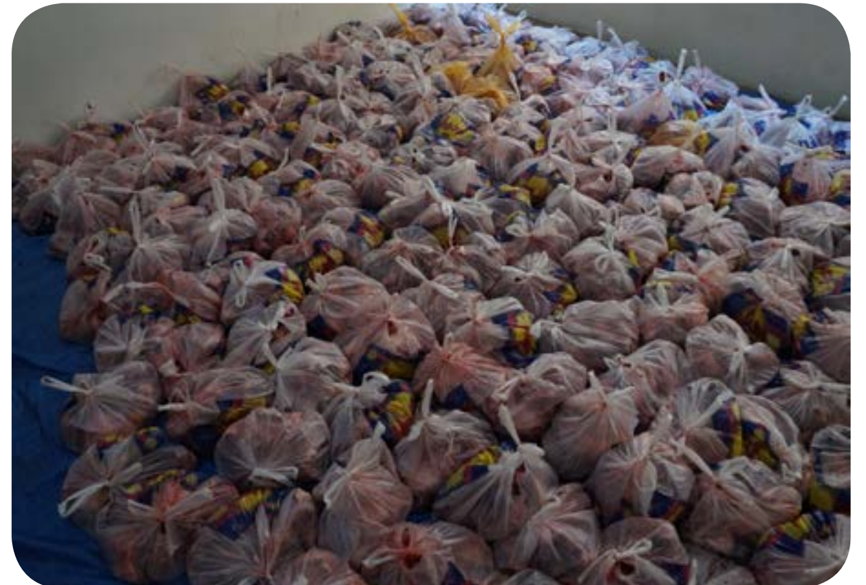
توزيع لحوم الاضاحي للأيتام المكفولين في احضان اسرهم