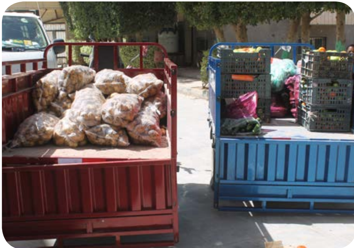
توزيع الخضار والفاكهة الأسبوعية