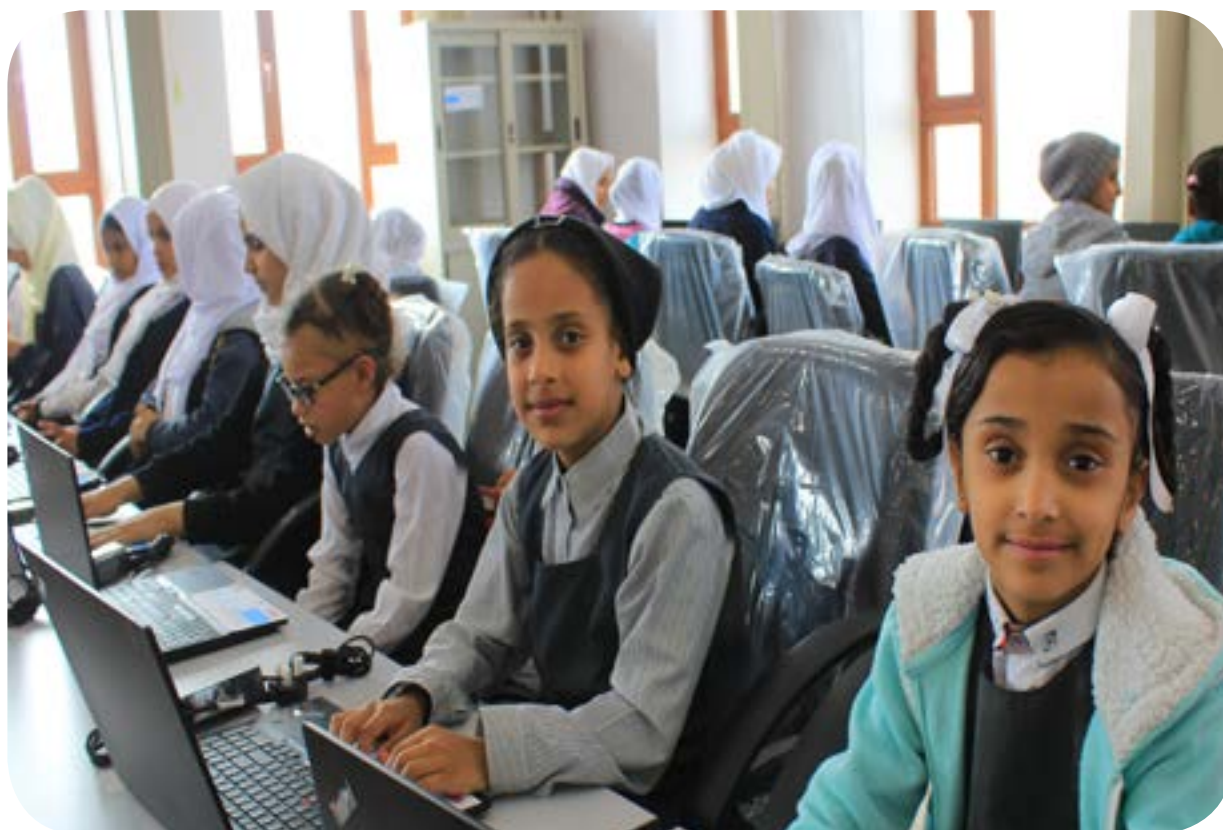
تأثيث معمل حاسوب - بنات