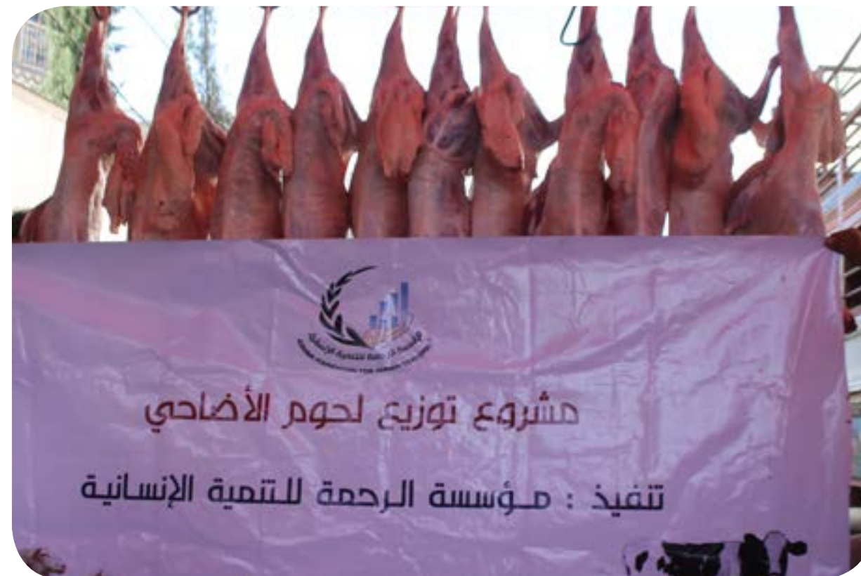
توزيع لحوم الاضاحي للسكن الداخلي