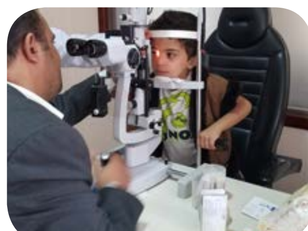
الفحص السنوي للعيون - بنين