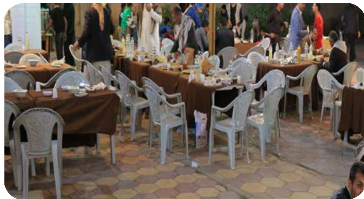
إفطار جماعي مع ضيوف المؤسسة