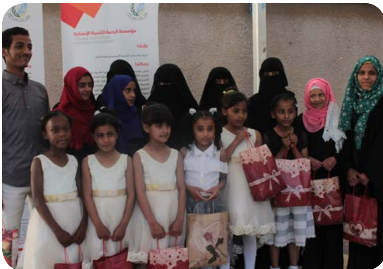
تكريم المتميزين للعام الماضي ٢٠١٨م