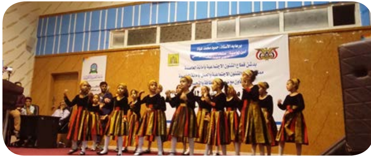
المشاركة في الفعاليات خارج المؤسسة