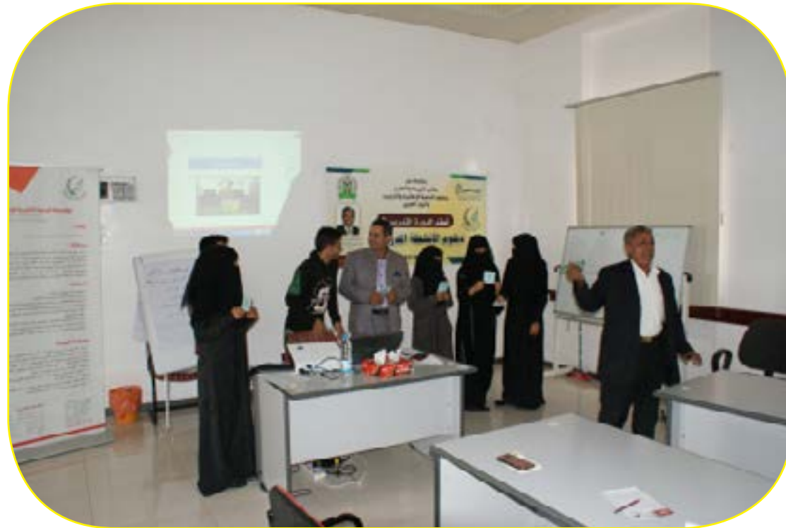
برنامج الأنشطة المدرسية