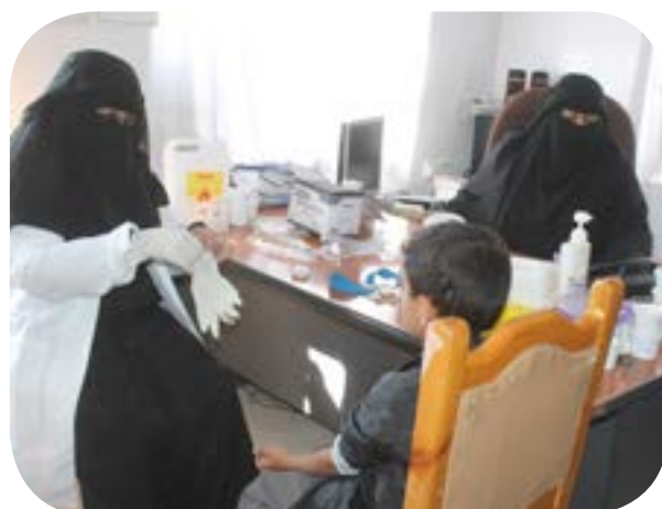
الفحص الطبي للملتحق الجديد