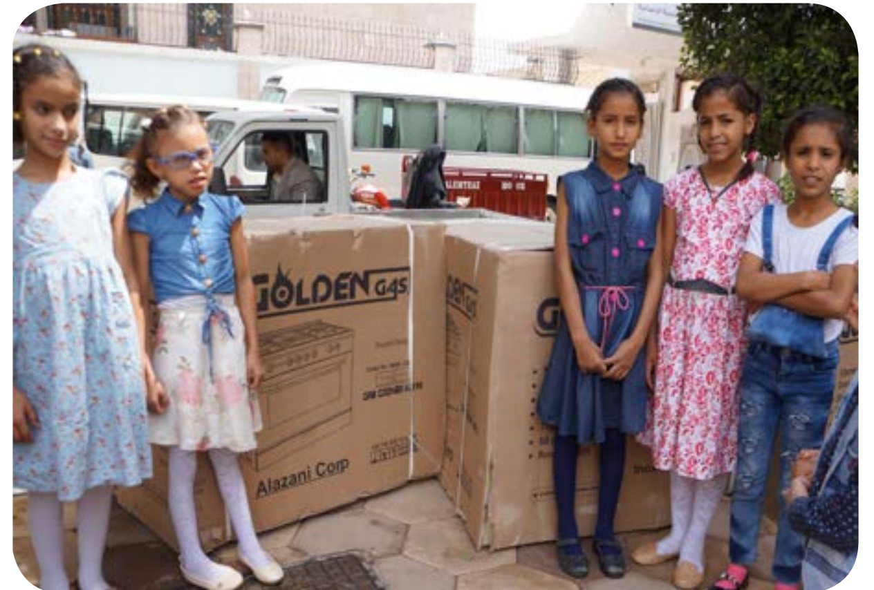
توزيع الأفران لشقق السكن الداخلي - المركز الرئيسي