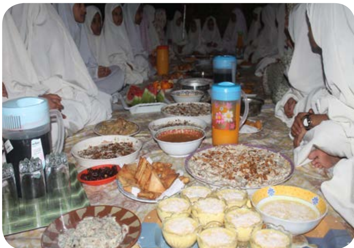
افطار صائم - بنات