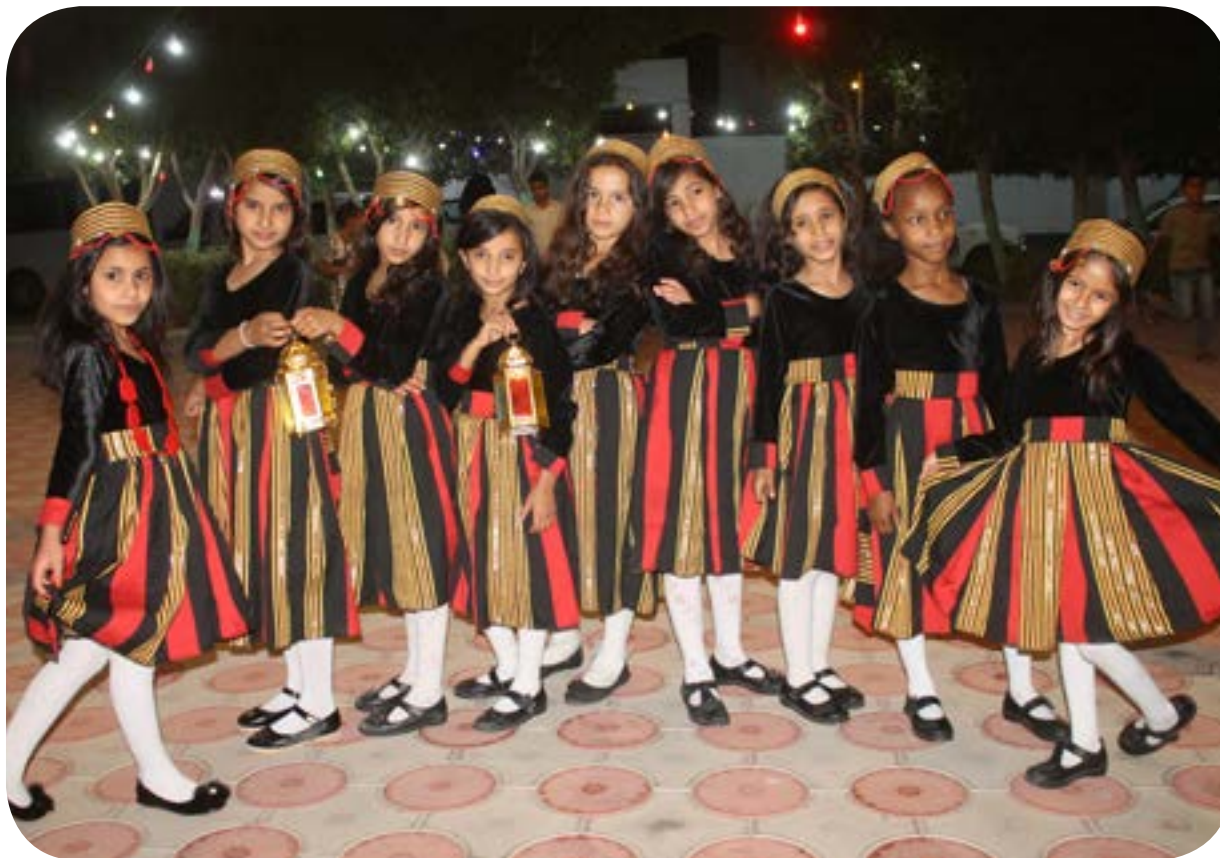
احتفالية استقبال شهر رمضان المبارك