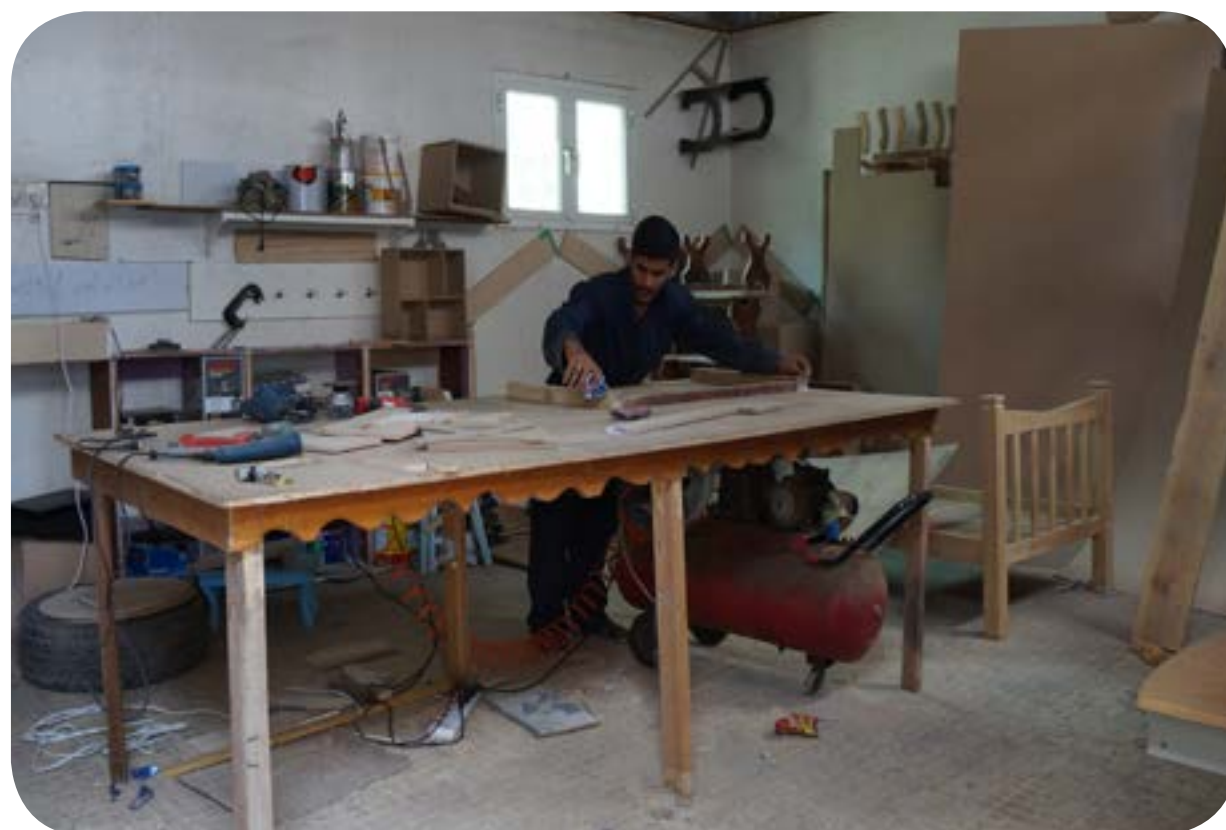
ورشة النجارة - خاصة بتدريب أبناء المؤسسة