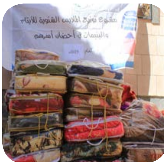
كسوة الشتاء والحقيبة الغذائية تلايتام المكفولين في احضان أسرهم