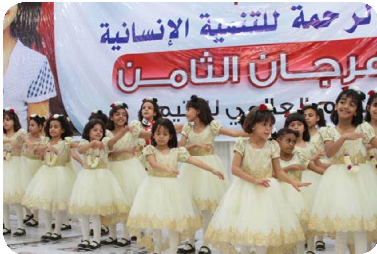
فعالية مهرجان اليتيم - فرع محافظة اب