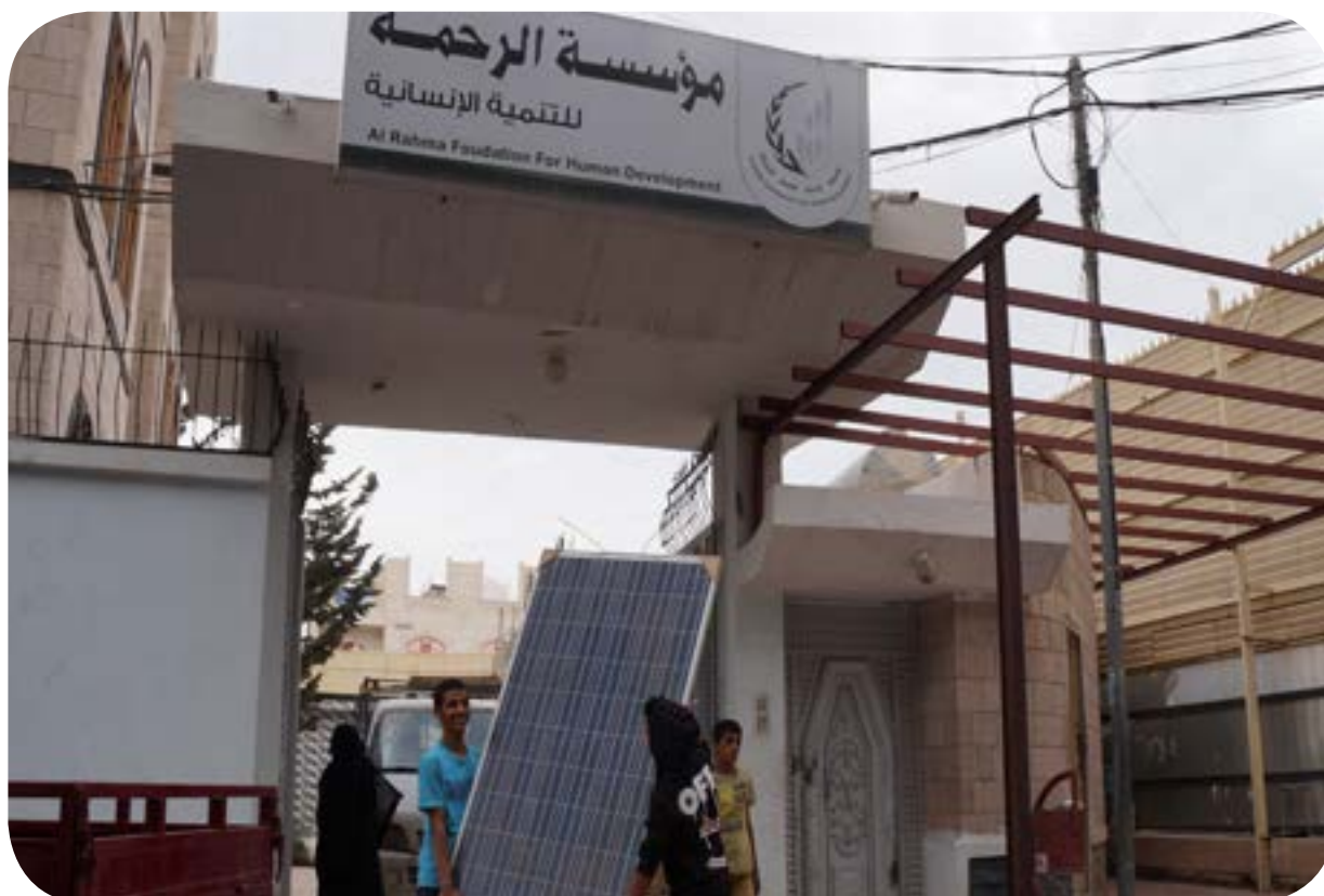
توريد وتركيب الطاقة الشمسية - بنين