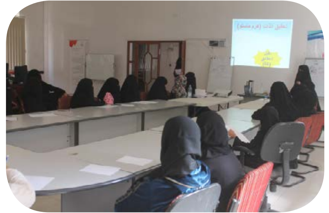
فن التعامل مع الآخرين